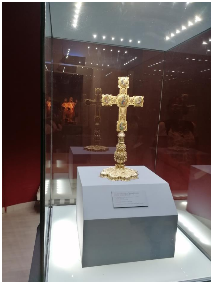
fig. 2 - Museo Diocesano Cosenza, Stauroteca - a. 1222 (Lato A)

committenza reale sin dall'età ruggeriana aveva sterzato su Bisanzio e sui suoi mosaicisti per proporre persuasive formule d'immagine, di devozione, di potere» 11 .