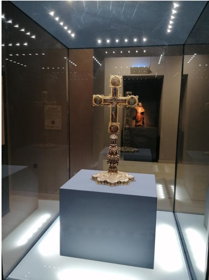
fig. 3 - Museo Diocesano Cosenza, Stauroteca - a. 1222 (Lato B)

Giustamente il Pace considera questo prezioso oggetto devozionale, al pari del codice purpureo rossanense 12 , quale