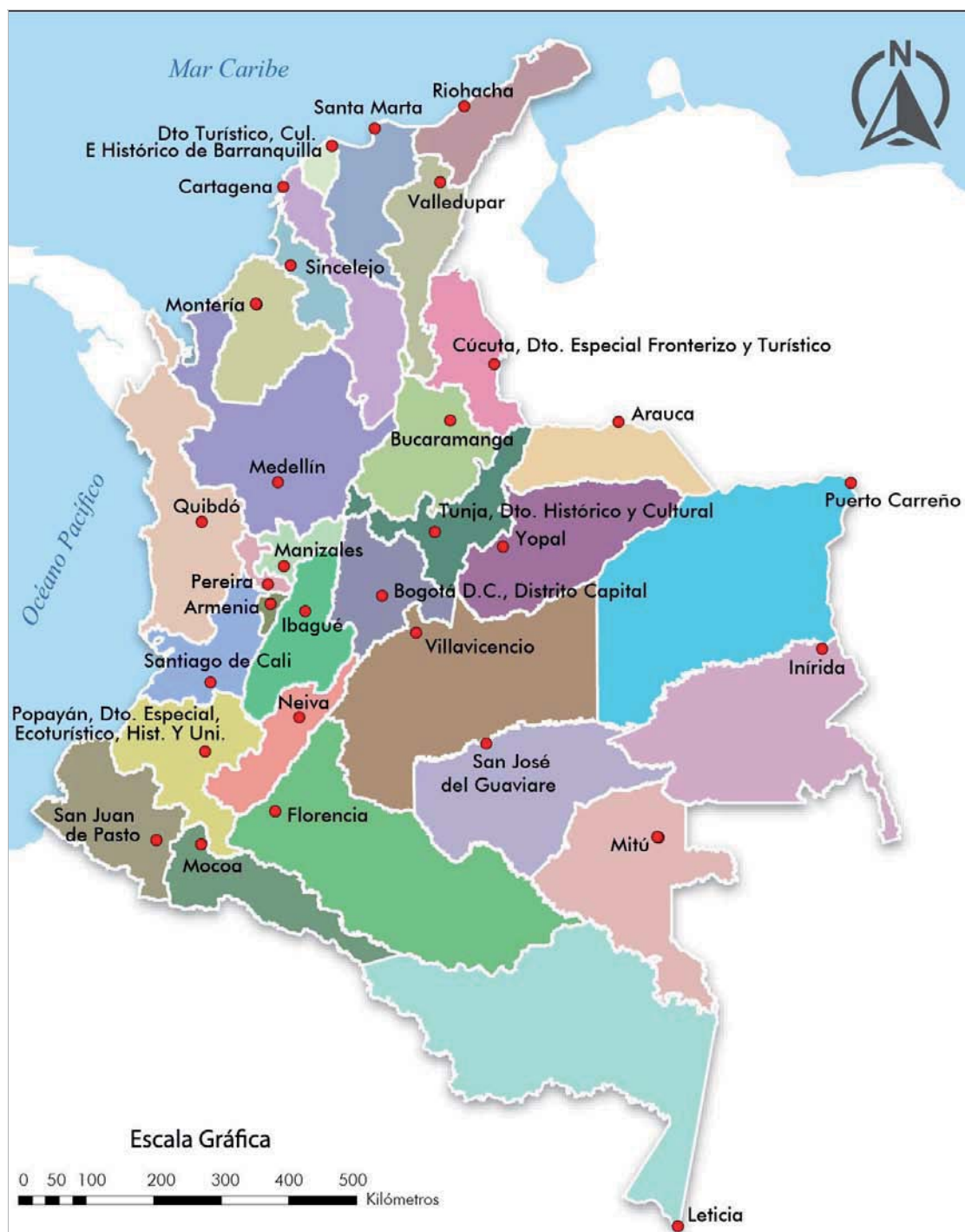
Figura 1. Departamentos y Distritos. República de Colombia