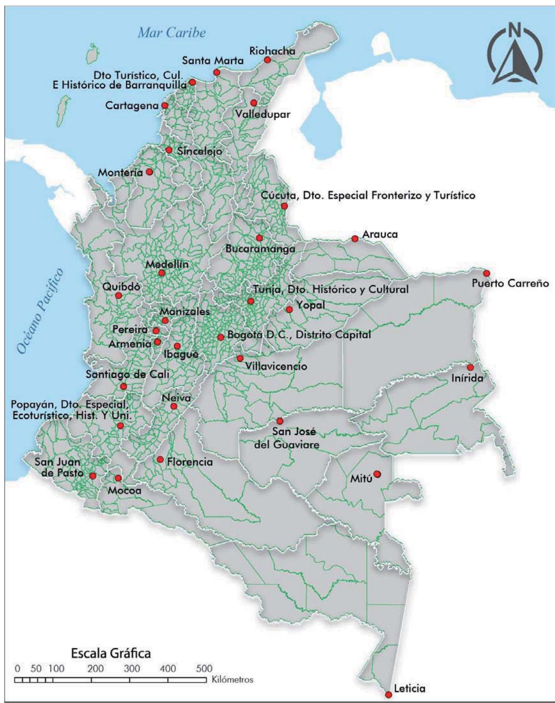
Figura 2. Municipios. República de Colombia