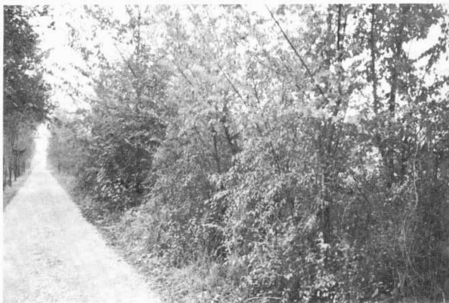
Siepe che costeggia una stradina di campagna nel trevigiano

Le siepi e i lembi relitti di boschi e foreste sono pertanto le uniche riserve biogenetiche che potrebbero (in teoria) ricostituire le originarie formazioni, precedenti all'utilizzazione agraria (GIACOMINI, FENAROLI, 1958; TOMASELLI C., E., 1973).