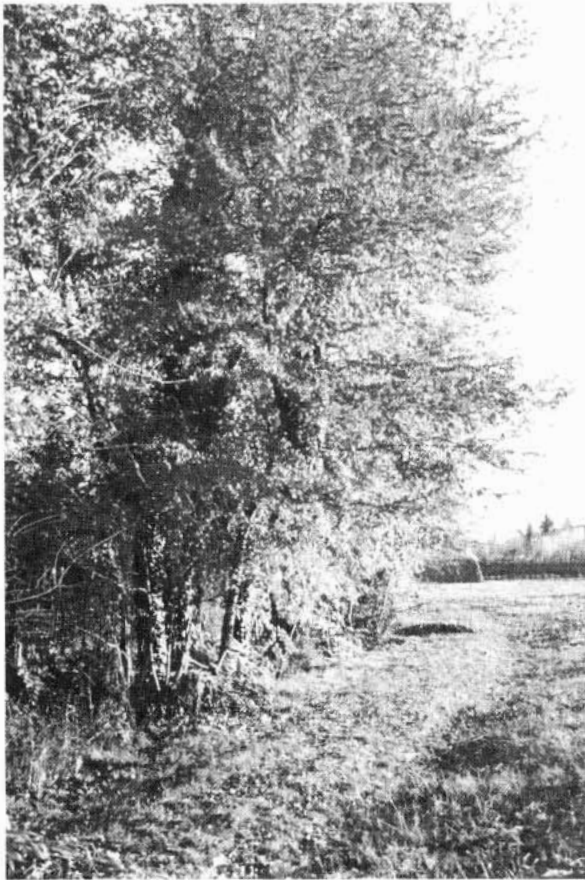
Tipica siepe di delimitazione di un campo nell'entroterra veneziano.

È quindi ovvio che ciò che rimane delle foreste e le stesse siepi, rappresentano qualcosa di molto importante in quanto costituiscono una testimonianza del passato e possono inoltre dare utili informazioni circa la potenzialità dell'ambiente e cioè della possibile evoluzione del territorio, nel caso in cui le pratiche agrarie venissero a cessare. Non va dimenticato che, come già sostenuto dal Tarello nel XVI sec. (1816) la stessa C.E.E. introdurrà delle normative volte alla periodica sottrazione all'Agricoltura di circa un 25-30 per cento delle superfici attualmente utilizzate, da destinare ad un riarricchimento del suolo, attraverso un nuovo sviluppo di cenosi naturali.