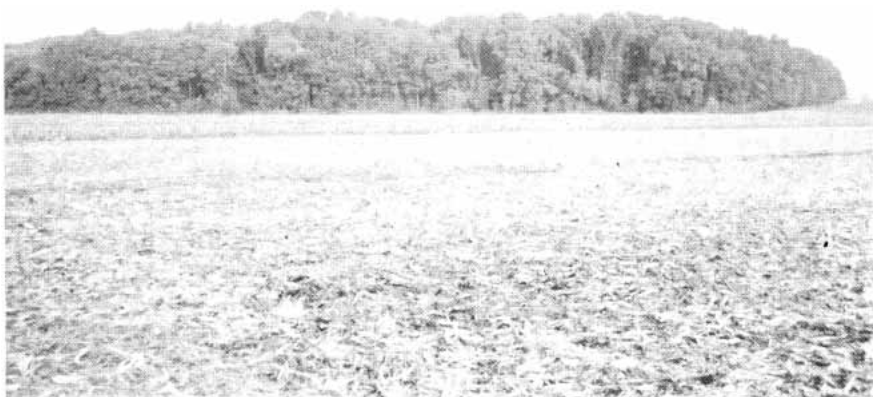
Margine esterno del relitto di bosco planiziale di Basalghelle (Treviso)

Dove sono assenti anche questi relitti di vegetazione naturale, all'interno delle zone coltivate, si può osservare come le siepi di delimitazione dei campi, anche se di origine artificiale e controllate