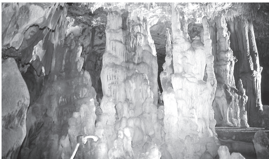
Fig. 3 - Grotta di Monte Vicoli. Gli imponenti colonnati (N. Marinosci).

Grotta di Monte Vicoli (Pu/Br 522) - Carta I.G.M. 203 IV N-W - long. 5° 02' 58"; lat. 40° 38' 21". Quota: m 282 s.l.m. Interessante cavità che si apre sul monte omonimo, 1 km a SW dell'abitato. Il sistema carsico si sviluppa negli strati calcarei fossiliferi debolmente inclinati ad E, con un andamento sub-orizzontale poco profondo. L'ingresso, ampliato artificialmente negli anni '60, munito di cancello, conduce attraverso una scalinata e un camminamento in cemento, in una grande sala ricca di imponenti e suggestivi speleotemi (Fig. 3). La grotta è lunga circa 50 m (LADDOMADA and LEPORALE, 2004).