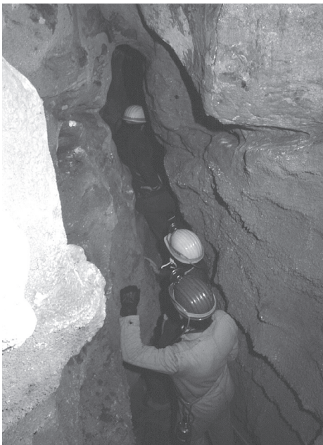
Fig. 4 - Grave di Zizze. Progressione nella diaclasi.

Grotta Madonna della Grotta (Pu/Br 527) - Carta I.G.M. 203 IV N-O - long. 5° 07' 19"; lat. 40° 36' 36'. Quota: m 197 s.l.m. La cavità è ubicata al di sotto della Basilica e prende il nome dall'omonima contrada che dista circa 6 km in direzione SE da Ceglie Messapica. Superato il bellissimo portale si giunge