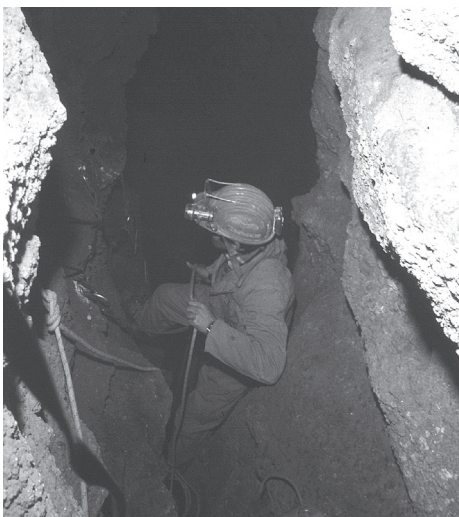
Fig. 5 - Grave di Zizze. Sull'orlo del pozzo.